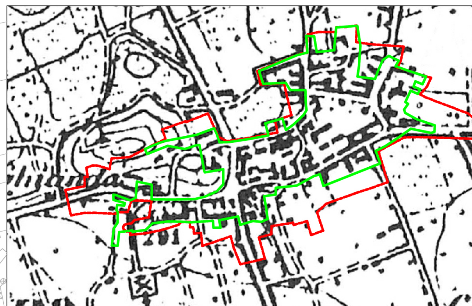
Estratto IGM 1884