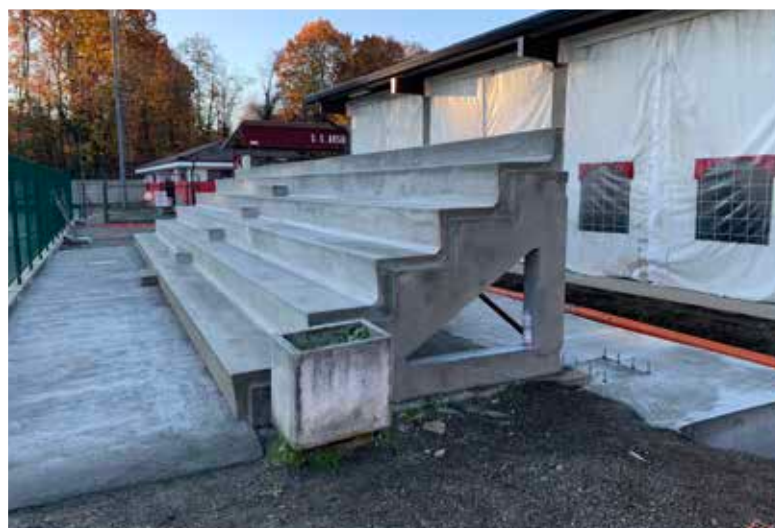
Nuova tribuna campo sportivo ▶