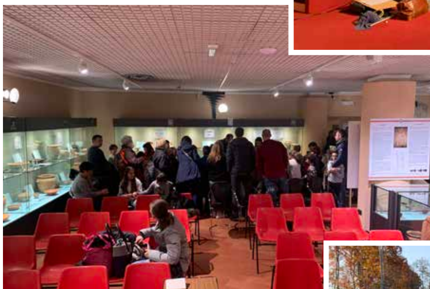
▲ Evento presso il Civico Museo Archeologico e Paleontologico