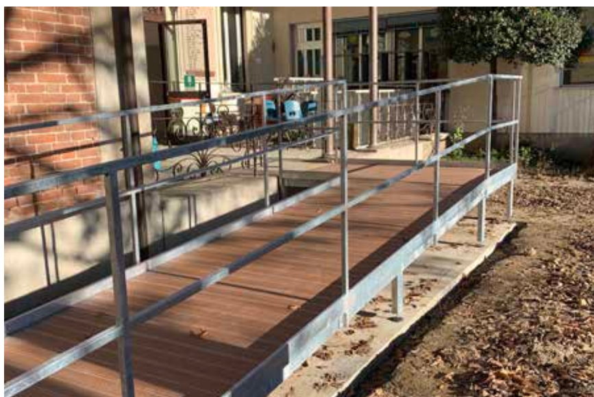
◀ Rampa presso Asilo Porraneo