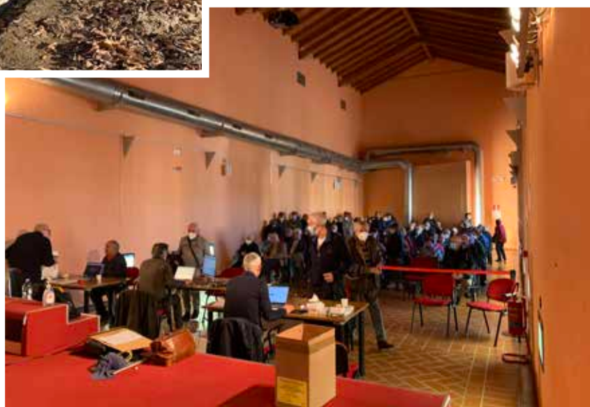
▲ Vaccini effettuati presso il Centro Culturale Concordia