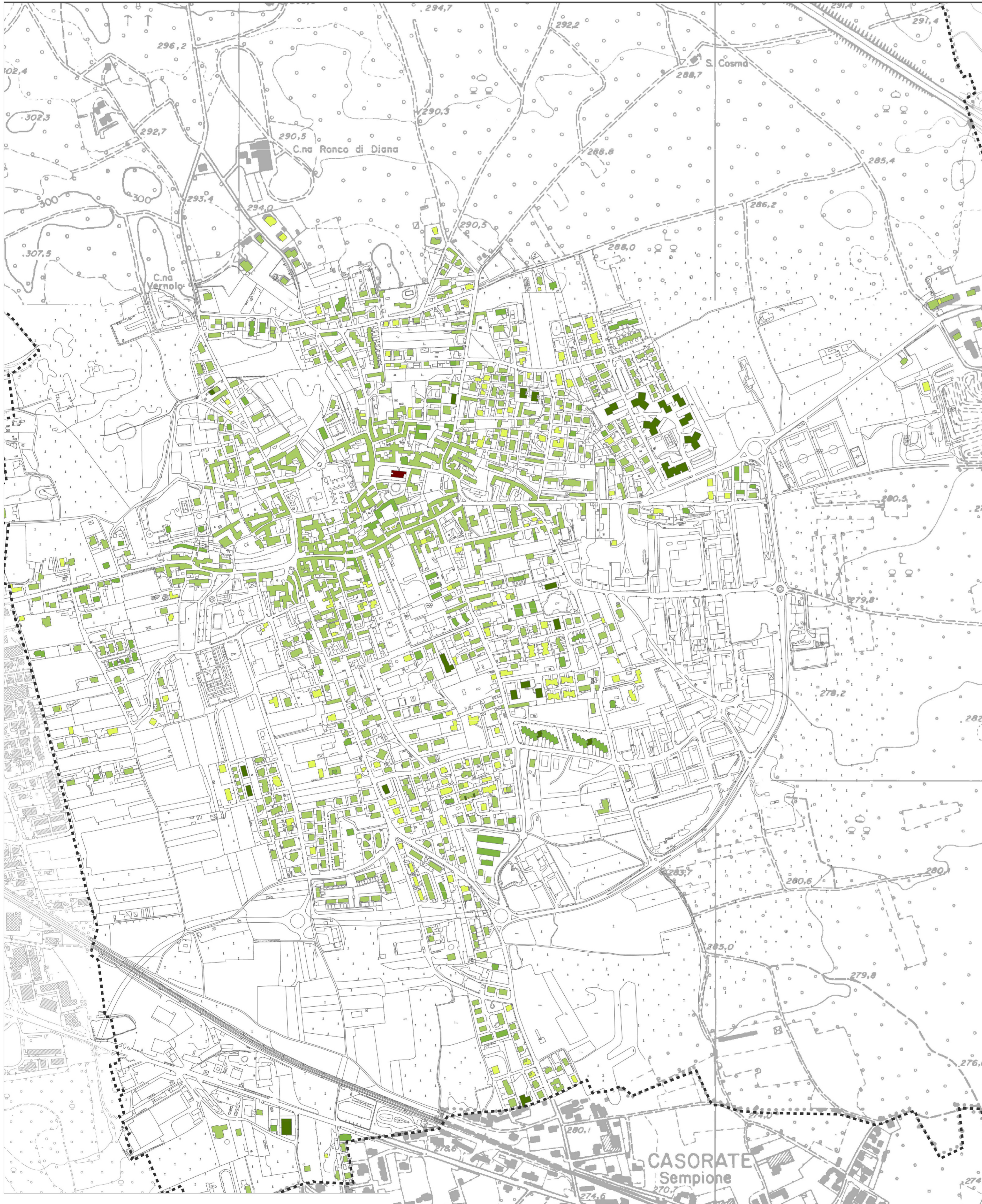
C - ALTEZZE DEGLI EDIFICI